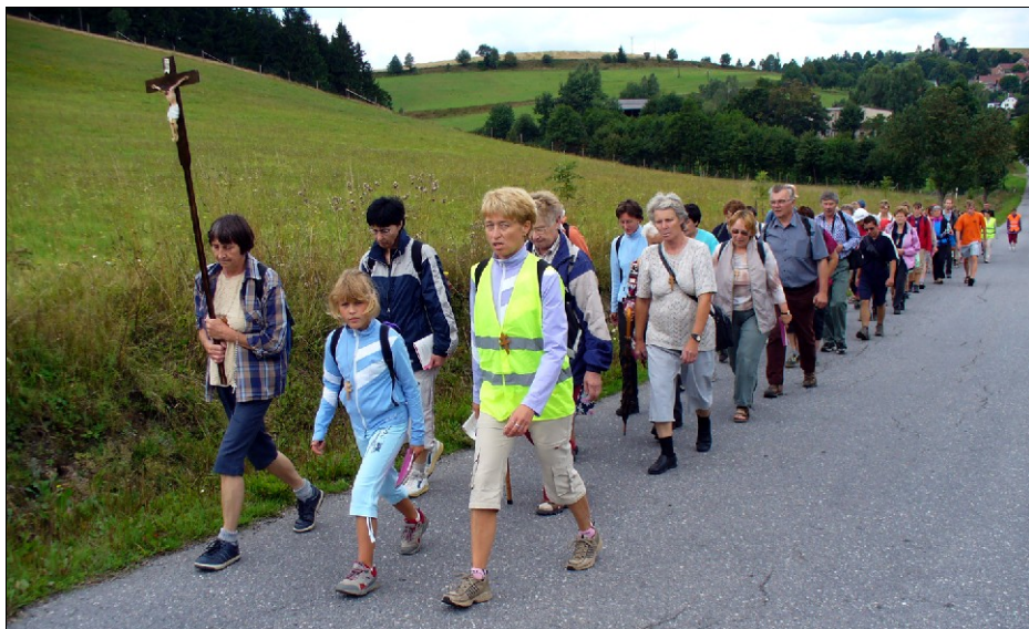
Poutníci se vydali směrem na Velehrad